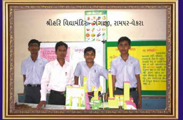
શ્રીહરિતપોવન ગુરુકુલ રામપર-વેકરા ગંગાજી - વિજ્ઞાન મેળામાં ઉપસ્થિત આયોજકો તથા સંચાલકો તથા પસંદગી પામેલ કૃતિ સાથે વિદ્યાર્થીઓ - તપોવન ગુરુકુલ