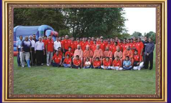
શ્રી કચ્છ સત્સંગ સ્વામિનારાયણ મંદિરના શ્રી સ્વામિનારાયણ યુવક મંડળના યુવાનોની ૪ દિવસીય શિબિરમાં સહભાગી યુવાનો તથા શિબિરમાં પધારેલ પ. પૂ. આચાર્ય મહારાજશ્રી તથા મંદિરના પ્રમુખ વિશ્રામભાઈ માયાણી - હેરો