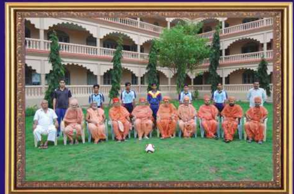
રાજ્યકક્ષાએ વોલીબોલ તથા ખો-ખો સ્પર્ધામાં પસંદગી પામેલા શ્રી સરજાનંદ ગુરૂકુલના વિદ્યાર્થીઓ - માનકુવા