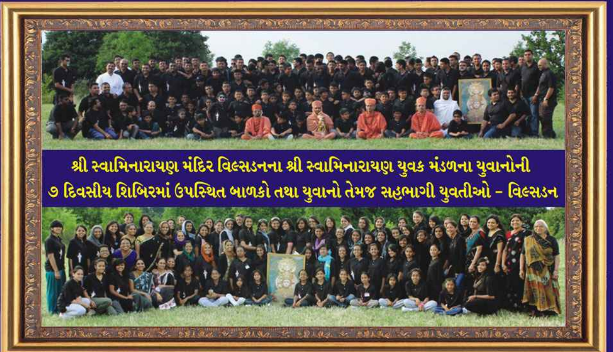
શ્રી સ્વામિનારાયણ મંદિર વિલ્સડનના શ્રી સ્વામિનારાયણ યુવક મંડળના યુવાનોની ૭ દિવસીય શિબિરમાં ઉપસ્થિત બાળકો તથા યુવાનો તેમજ સહભાગી યુવતીઓ - વિલ્સડન