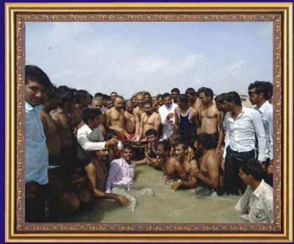
માંડવીમાં શ્રીજીમહારાજના પ્રસાદી સ્થળોના દર્શન કરવા ગયેલા કચ્છ શ્રી નરનારાયણદેવ યુવક મંડળના યુવાનો તથા સંતો - માંડવી