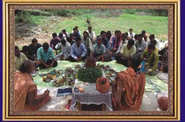
કચ્છ શ્રી નરનારાયણદેવ યુવક મંડળ રવાપર, નેત્રા, ગડાણી, આમારાના યુવાનો વનમહોત્સવમાં સંતોની અમૃતવાણીમાં મત્સ્યુલ ભક્તજનો.