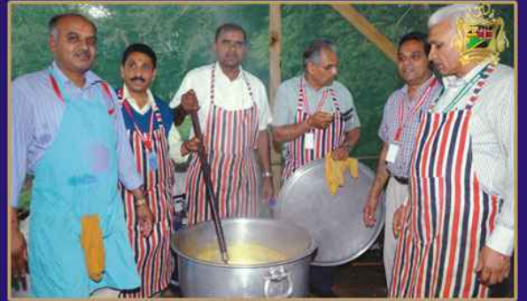
શિબિરાર્થીઓ માટે ભોજનની તૈયારી કરતા ભક્તો તથા બહેનો - નાઈરોબી