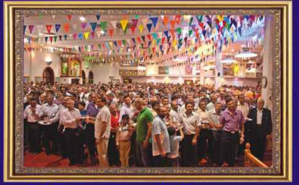
શ્રી. કચ્છ સત્સંગ સ્વામિનારાયણ મંદિર કેન્ટન હેરોમાં જન્માષ્ટમીના શુભદિવસે જન્મોત્સવની આરતીનો લાભ લેતા ભક્તો તથા બહેનો ભક્તો - હેરો.